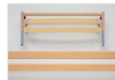
Bettverlängerung (auch nachträglich montierbar)