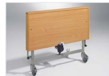
Holzfüllung zur Verkleidung des Fahrgestells (auch nachträglich montierbar)