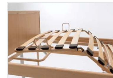
Unterschenkellehne durch Rastomat anhebbar